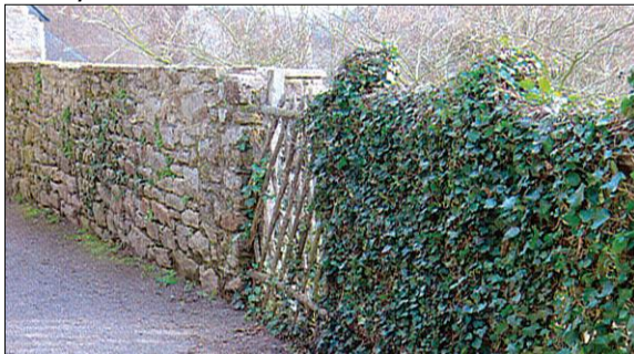
Clôture, mariant pierres, croisillons en bois et lierre.