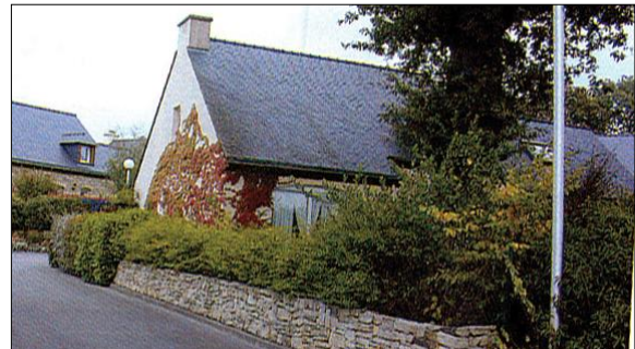
Muret de pierres sèches associé à une haie.