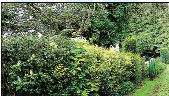
Haie composée d'essences champêtres et séparant deux propriétés.

Il est conseillé de réaliser des clôtures végétales en limite séparative en respectant la liste des végétaux présentés en annexe du règlement.